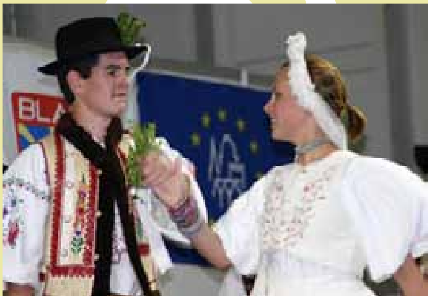
3 Taneční pár souboru Kriváň Východná. Praha 2005 (F. Synek)