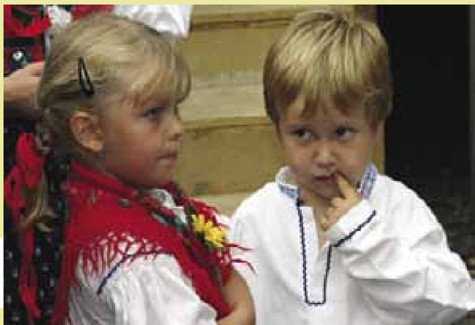
6 Malí tanečníci Krušpánku Praha. Praha 2005 (F. Synek)