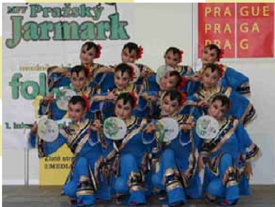
4 Dívčí skupina Shinx. Praha 2005 (F. Synek)