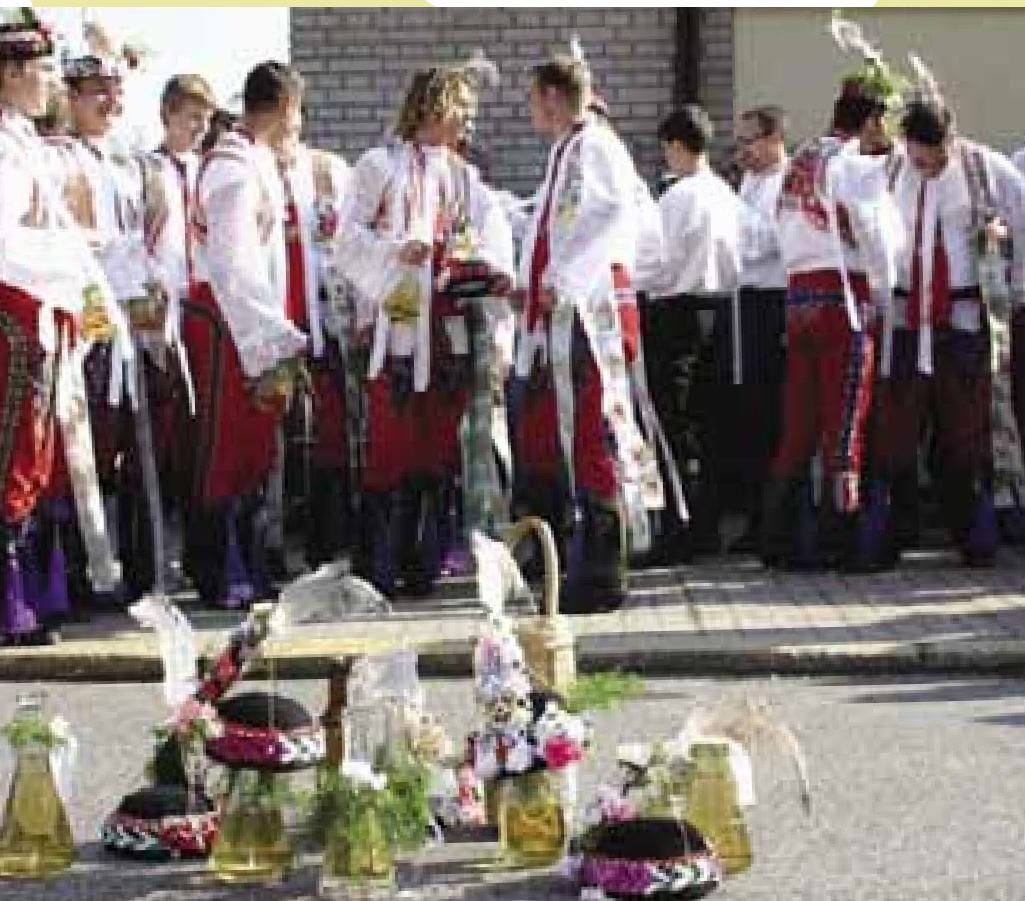
2 Hodová neděle. Dolní Bojanovice 2005 (F. Synek)