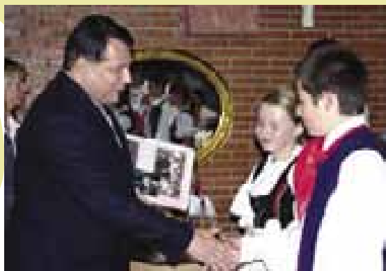
1 Premiér J. Paroubek s dětmi. Praha 2005