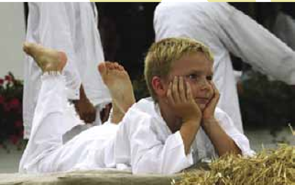
5 Pohoda klučiny z Břeclavánku Břeclav. Luhačovice 2005 (F. Synek)